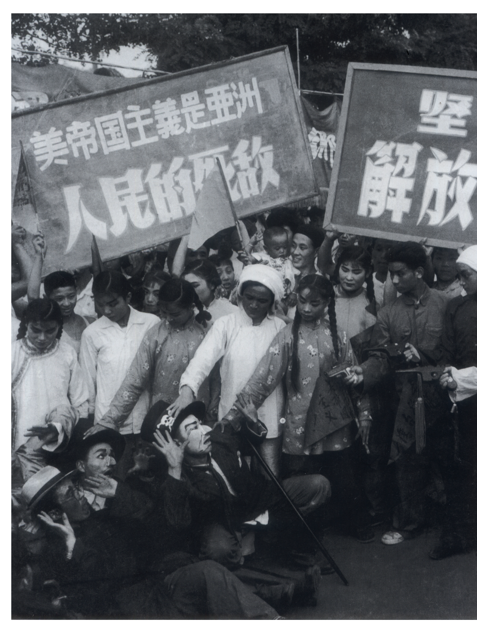
Straßentheater gegen den „amerikanischen Imperialismus“, 1954