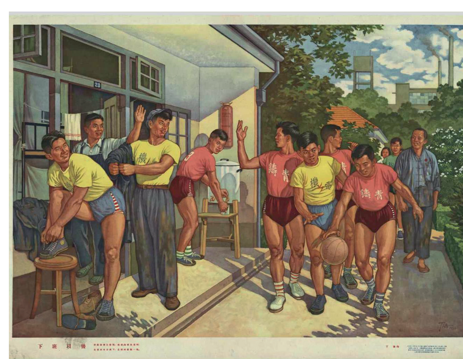
„Nach Feierabend“, Poster, 1954 (Sammlung Stefan Landsberger) chinese-posters.net