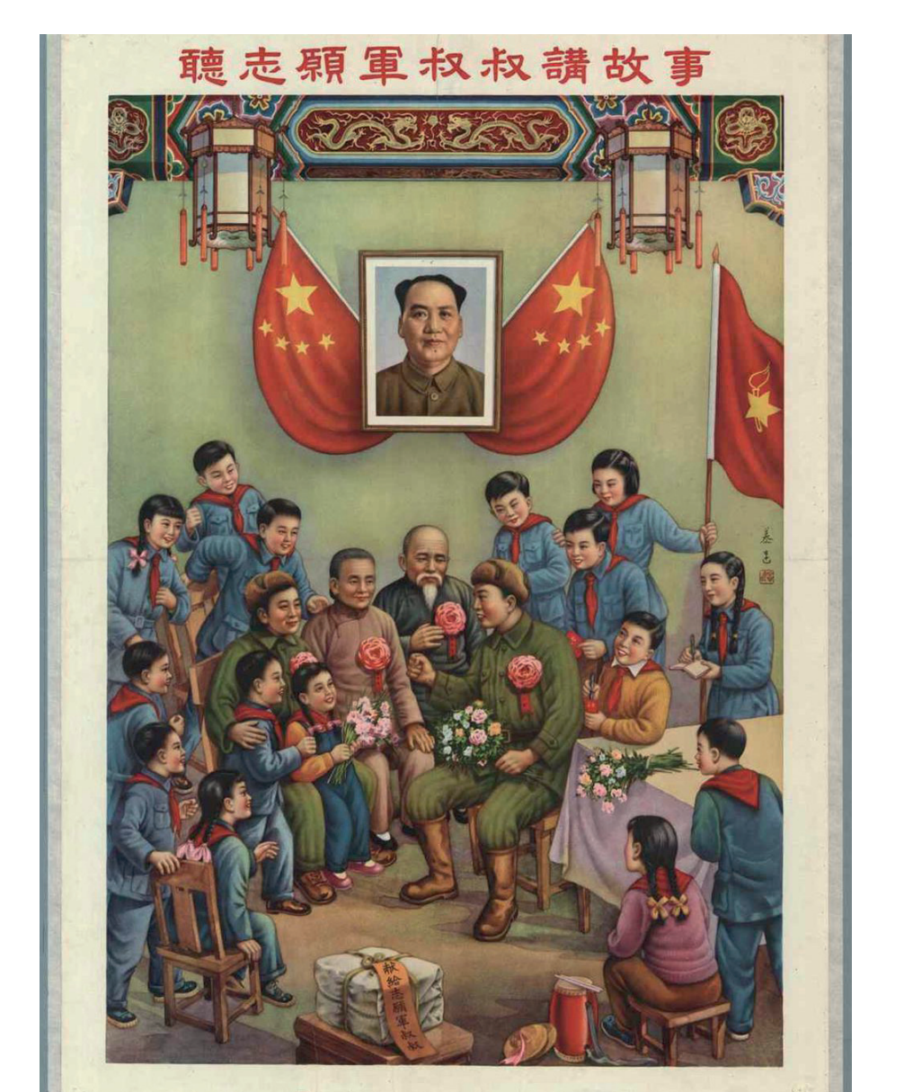
„Der Onkel von der Freiwilligen-Armee erzählt eine Geschichte“, Poster, 1954

In der ersten Projektphase (2012-2013) hat unsere Forschung gezeigt, dass die KPCh ab 1949 die Versorgung und Kontrolle von Flüchtlingen stärker durch den Staat zu bewerkstelligen versuchte als dies die Nationalisten (GMD) zuvor getan hatten. Der langfristige Erfolg dieser Politik lässt sich nur verstehen, wenn er als Teil einer breiten gesellschaftlichen Umgestaltung durch die KPCh verstanden wird.