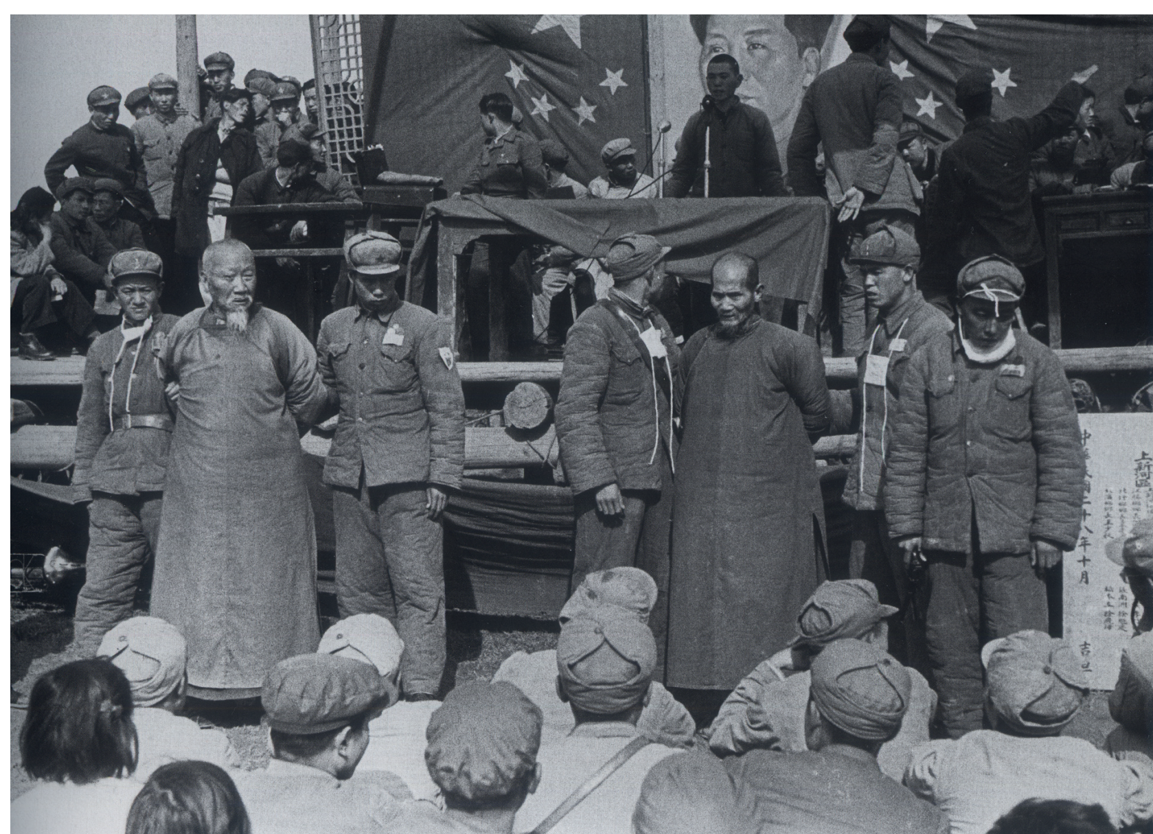
Verurteilung von Grundbesitzern im Rahmen der Kampagne zur Landreform, 1952